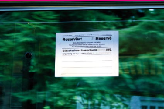
Ausflug BDI 2010